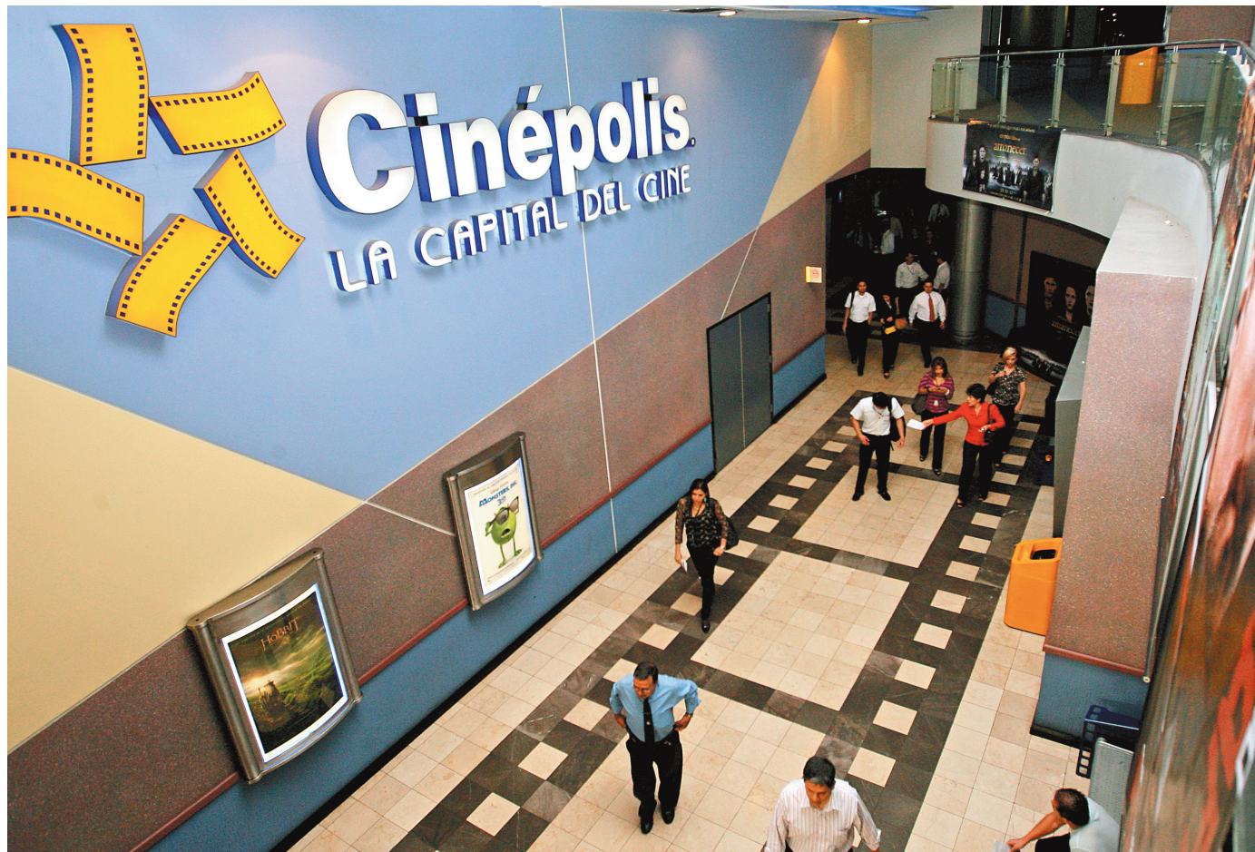
● Cinépolis no solo proyecta películas en las salas de exhibición, también sabe proyectar la cultura a sus colaboradores en la región.

miembros de su equipo, como llaman a los trabajadores.