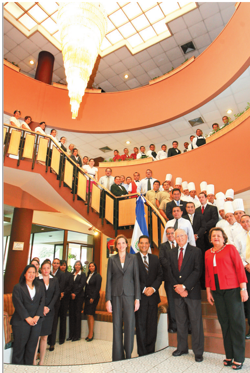
● El Hotel Terraza, de El Salvador, ha cosechado grandes éxitos a lo largo de tres años como una empresa TOP+.

Mientras tanto, SCA se posiciona como la de cultura organizacional más sólida en Costa Rica. La compañía especialista en soluciones de higiene supera así el octavo lugar que logró en 2011. En el segundo y tercer escaño queda Manpower, una firma que ha mejorado sólidamente su posición en los últimos años, y el hotel Hilton