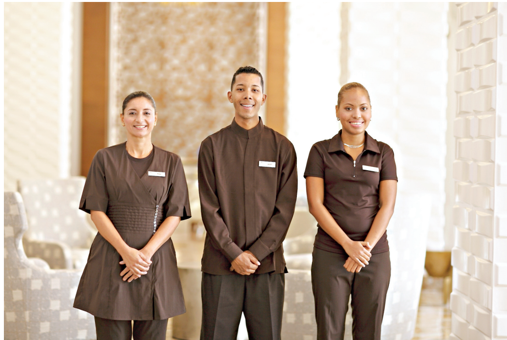
● El hotel Waldorf Astoria le apuesta al servicio de lujo y destaca en tan poco tiempo de operación.

50.5% de colaboradores de las TOP+ superan los dos años de trabajo.