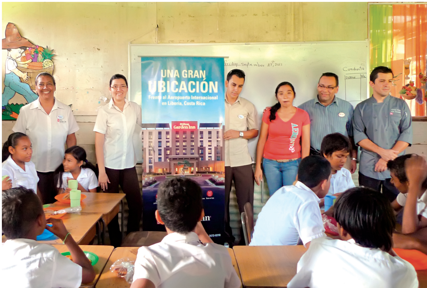
● El Hotel Hilton Garden Inn Liberia Airport, en Costa Rica que compitió por primera vez en el ranking, destaca por su compromiso social.