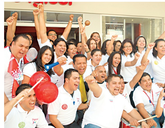
● Digicel, en El Salvador, compitió por primera vez e ingresó al Ranking TOP+ gracias a su vibrante personal.

La compañía pone sus recursos en las actividades ordinarias que generen resultados extraordinarios, agrega. “Dentro de la organización se ha identificado a un grupo de líderes, este equipo es el ‘Revolution Team’ y está formado por personal de todas las áreas de la em-