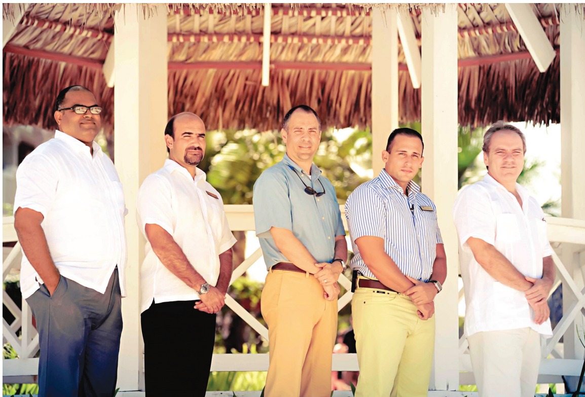
● AMResorts se llevó el primer lugar en el III Ranking de Empresas TOP+ de Centroamérica y el Caribe 2013.

“Las calificaciones han mejorado. También vemos mucho más equilibrio y compromiso en los factores de la cultura organizacional.”